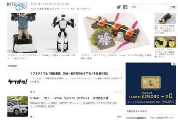
インターネットコム ホームページ

「毎日の生活を楽しむためのモバイル機器、家電、ガジェット、クルマ、トレンドなどの最新のニュースを日々発信するニュースサイト」